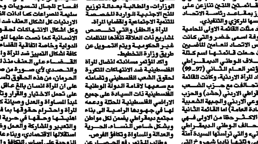
صان، والقدس العربي